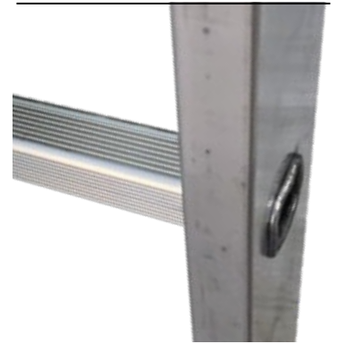
Gradino 30x30 mm. 30x30 mm step.

SU OGNI PRODOTTO VENGONO RIPORTATE LE INFORMAZIONI RICHIESTE DAL D.L. 81 ALLEGATO XX THE INFORMATION REQUESTED BY L.D. 81 ART. XX ARE AVAILABLE ON EACH PRODUCT