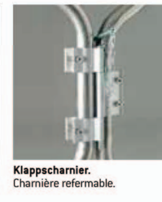
Klappscharnier. Charnière refermable.