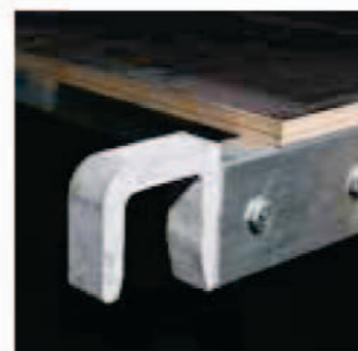
Robuste Aluminiumhaken. Solides crochets en aluminium.