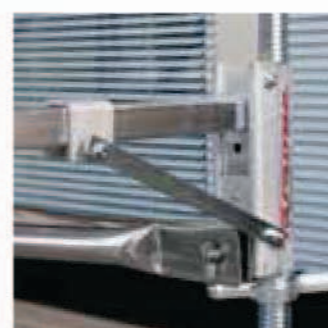
Basis-Kit mit Zusatz-Verstärkung. Kit base avec renfort.

ZUSAMMEN- KLAPPBARES KIT INBEGRIFFEN REFERMABLE INCLUS